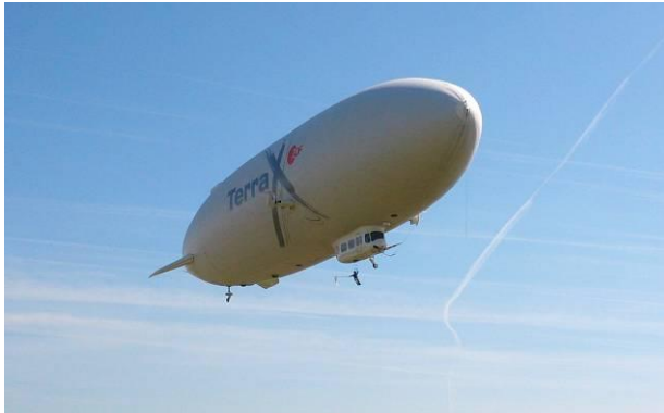
Dirk Steffens sammelt Luftplankton